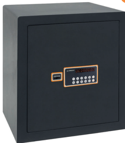
PLUS-C Τύπος 180070